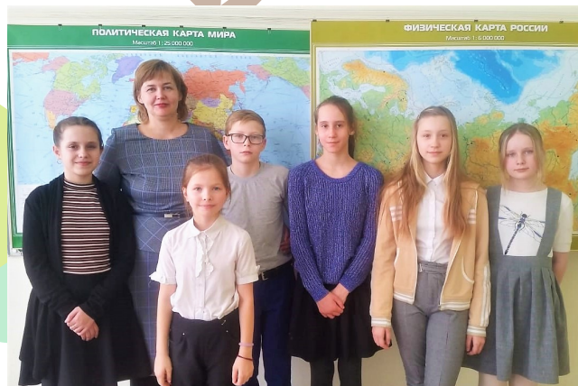
Над статьёй работали: Толкачева Софья, Жегалова Ольга, Бажина О.С.

- Проектная исследовательская деятельность учит учащихся отбирать информацию, структурировать её, публично выступать. Метод проектов повышает мотивацию к учёбе: ученик может выбрать интересную для себя тему, нет нудной зубрёжки, появляется глубокое понимание изучаемой темы, включается процесс самообразования.