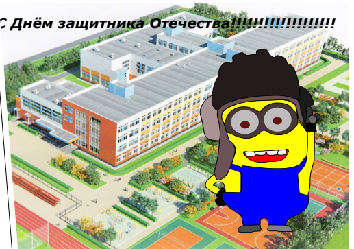
Муниров Максим 6Б